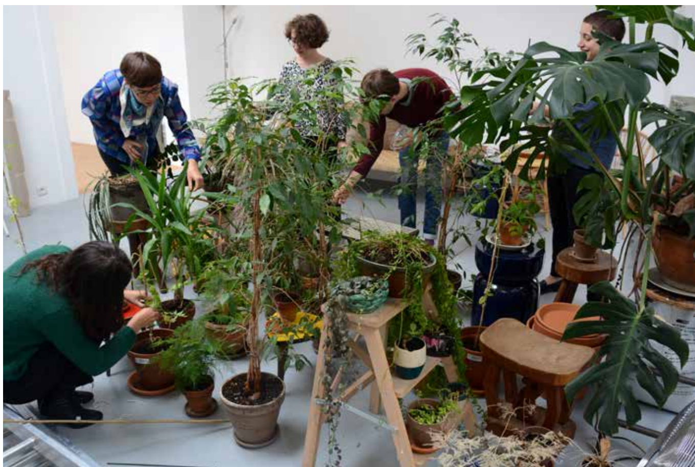
Montage de La Permanence , septembre 2017.