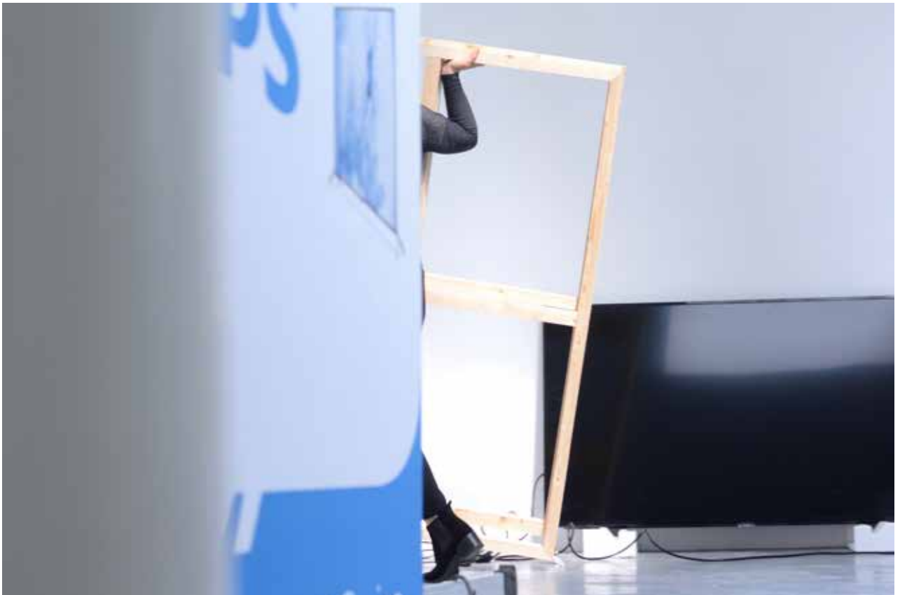
Montage de La Permanence , septembre 2017.