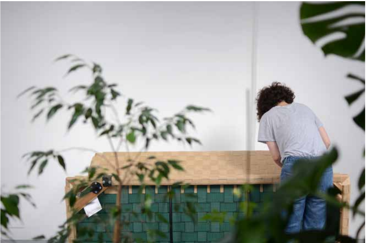
Montage de La Permanence , septembre 2017.