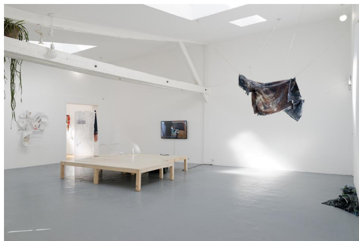
Vue de l'exposition Demain est une île à la Villa Vassilievff, Paris, 2016. Avec les œuvres de Lucas Semeraro, Thelma Capello & Rafael Moreno, Mathieu Brion et Gaëlle Choisne.