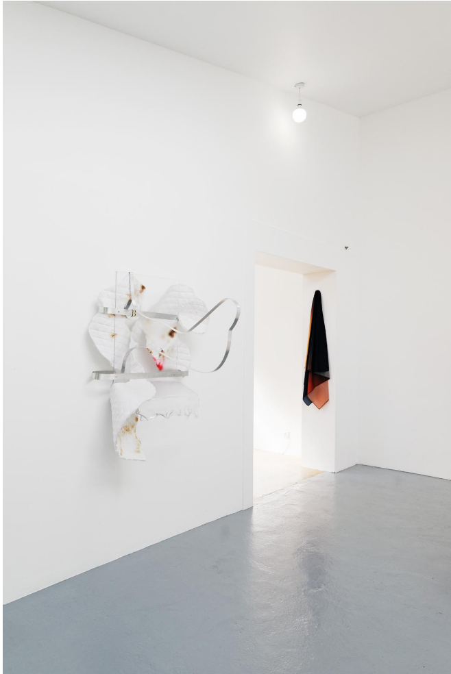
Vue de l'exposition Demain est une île à la Villa Vassilieff, Paris, 2016. Avec les œuvres de Lucas Semeraro et Jason Wee.