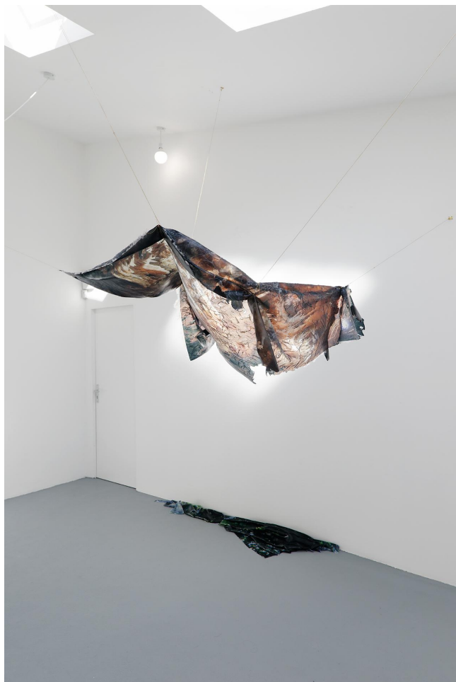
Gaëlle Choisne, Peaux de chagrin, 2016, impression couleur, silicone, chaînes dorées, Courtesy Untilthen, Vue de l'exposition Demain est une île à la Villa Vassilievff, Paris, 2016. Image : Aurélien Mole.