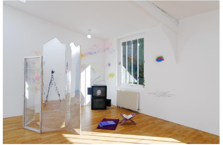
Nathalie Muchamad, Un commencement est un moment d'extrême délicatesse (d'après la princesse Irulan), 2016 ; paravent, H180 x L 210 cm ; La Prophétie (d'après Dune), 2016, 1'30''30, vidéo ; Vue de l'exposition Demain est une île à la Villa Vassilieff, Paris, 2016.