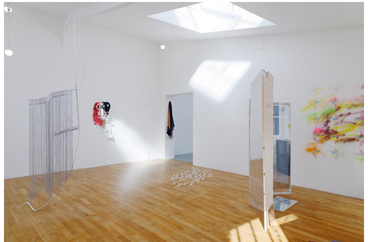
Vue l'exposition Demain est une île à la Villa Vassilieff, Paris, 2016. Avec les œuvres de Lucas Semeraro, Jason Wee, Anna Ren et Nathalie Muchamad.